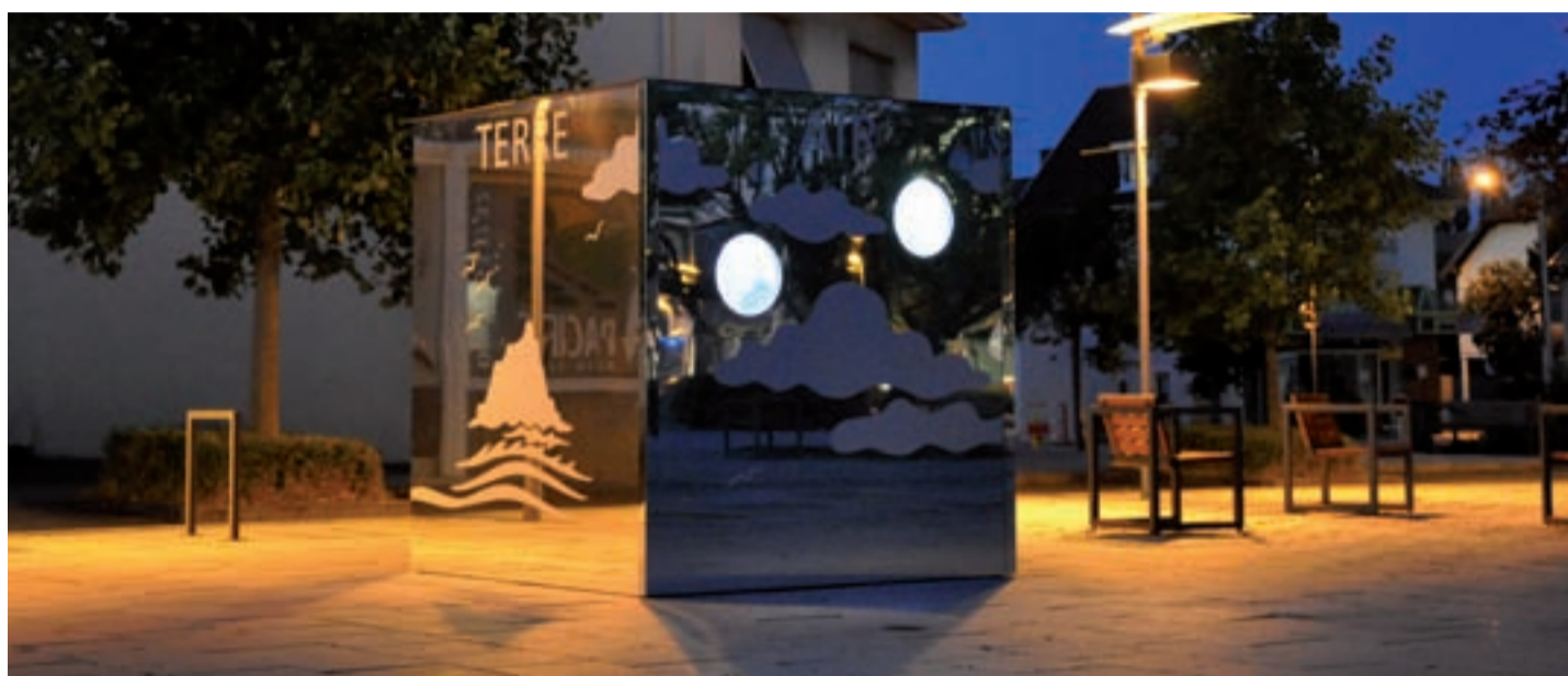
Le "Musée de la nature", conçu par l'artiste plasticien Bernard Latuner et réalisé par l'entreprise Buhler. Ce cube de 2,20 x 2,20 m est décoré par des miroirs dans lequel se reflète à l'infini un chant de coquelicots.

"Communication, image de marque, publicité, savoir-faire et faire-savoir" est indispensable aujourd'hui. Il faut se montrer sous ses plus beaux atours, occuper le terrain, en d'autres mots, être vu. Les entreprises de marquage et de communication visuelles sont les premières sollicitées lors d'une création d'entreprise, pour l'habillage des véhicules, la pose d'enseignes ou la décoration d'une vitrine.