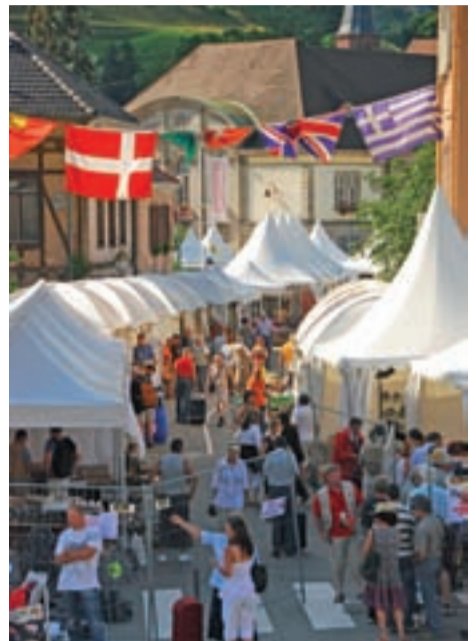
Vue du Salon à Sainte-Marie-aux-Mines