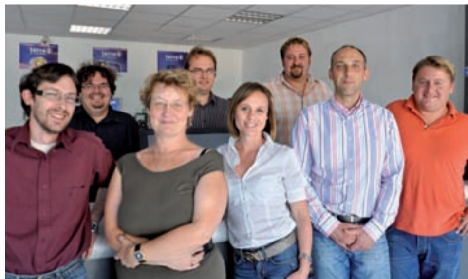
L'équipe de Trustinfo

L'entreprise de services informatiques a connu une belle évolution depuis 10 ans, qui a suivi celle du marché : à l'origine boutique informatique, elle s'est développée grâce à l'installation et à la maintenance de parcs de machines et de réseaux. Elle mise aujourd'hui sur le marché en croissance de la fibre optique et des services associés.