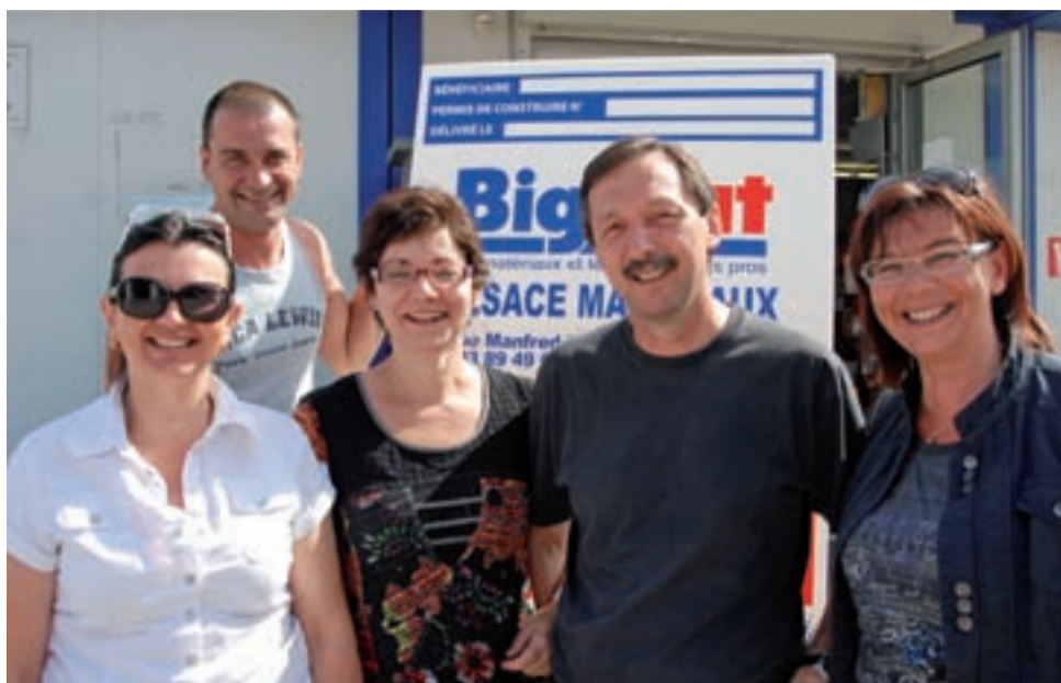
L'équipe d'Alsace Matériaux