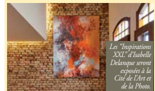
Les "Inspirations XXL" d'Isabelle Delanque seront exposées à la Cité de l'Art et de la Photo.

Route de Thann à Lutterbach Entrée, exposition, parking et spectacle gratuits Restauration sur place Exposition et rencontres avec les artistes Promenade nocturne et féérique vendredi 15 novembre à 19 heures - Inédit !