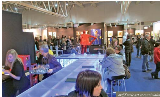
art3f mêle art et convivialité

Sélectionnés par un comité formé de 2 galeristes, 2 collectionneurs et 2 artistes, les exposants doivent présenter des œuvres dont la démarche est aboutie. La sélection couvre une large palette en termes et styles et de prix (de 500 à 50000 euros) qu'on trouve rarement ailleurs. « On a critiqué l'an dernier le niveau parfois inégal de certaines œuvres. Mais c'est un choix. Cette année, nous élevons un peu le niveau d'exigence, tout en proposant 50% d'artistes nouveaux. » Serge Beninca fréquente tous les salons reconnus pour démarcher les galeries et les artistes. Ceux-ci apprécient le concept général, et en particulier les stands dont les cloisons atteignent 3 mètres de haut, avec une bonne qualité de prestation (lumière, surface, emplacement), même si on est dans les prix du marché. « Nous sommes les seuls à