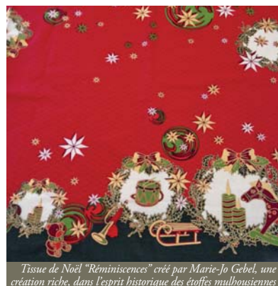
Tissu de Noël "Rémémorances" créé par Marie-Jo Gebel, une création riche, dans l'esprit historique des étoffes mulhousiennes

■ Contact : Marie-Jo Gebel Gebel Créations 03 89 66 50 80 - 06 07 31 34 20