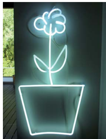
Une création de Saadane Affif

■ Contact : Nature Addicts Fund 37 rue Vaneau à Paris contactnaf@na-natureaddictsfund.org na-natureaddictsfund.org