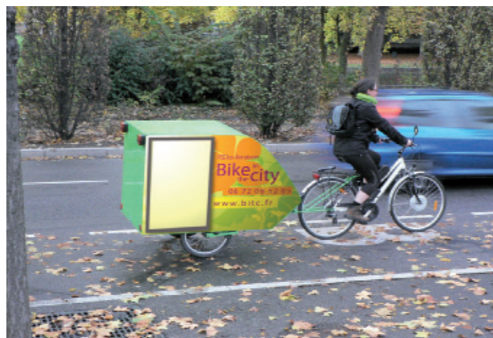
Distribution du PériScope par la jeune société : « Bike in the city »

Le PériScope tient à jouer un rôle citoyen, à la fois en soutenant le monde des entreprises et par son mode d'organisation. Il est toujours imprimé sur papier recyclé et sa distribution s'effectue dans le respect du développement durable grâce à son partenariat avec une petite entreprise « Bike in the City » qui réalise la distribution à vélo sur la zone Ouest. Cette impression et cette distribution écologique inscrit le PériScope dans un développement économique durable .