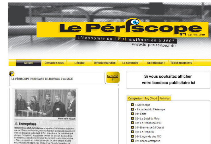
Page d'accueil du blog du Périscope : http://www.le-periscope.info/

Le Périscope est structuré en plusieurs rubriques, la rédactrice en chef conçoit et propose les sujets à ses partenaires et rédige l'intégralité du journal, sauf interventions ponctuelles de pigistes. Tous les articles du journal sont publiés dans le blog, ainsi que des brèves sur l'actualité économique locale.