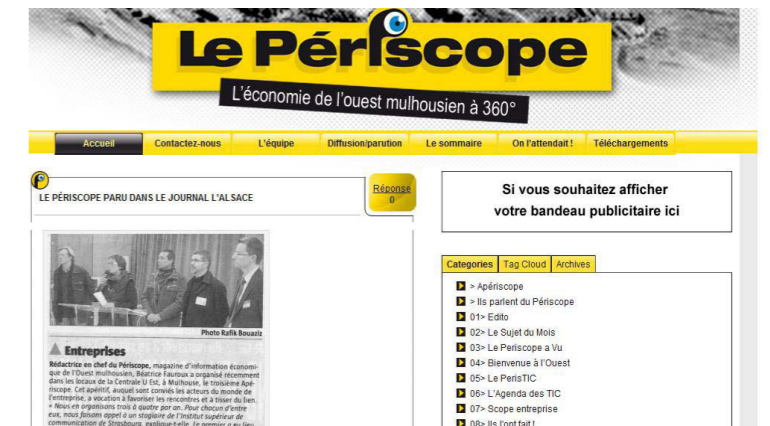
Page d'accueil du blog du Périscope : http://www.le-periscope.info/

Le Périscope est structuré en plusieurs rubriques, la rédactrice en chef conçoit et propose les sujets à ses partenaires et rédige l'intégralité du journal, sauf interventions ponctuelles de pigistes. Tous les articles du journal sont publiés dans le blog, ainsi que des brèves sur l'actualité économique locale.