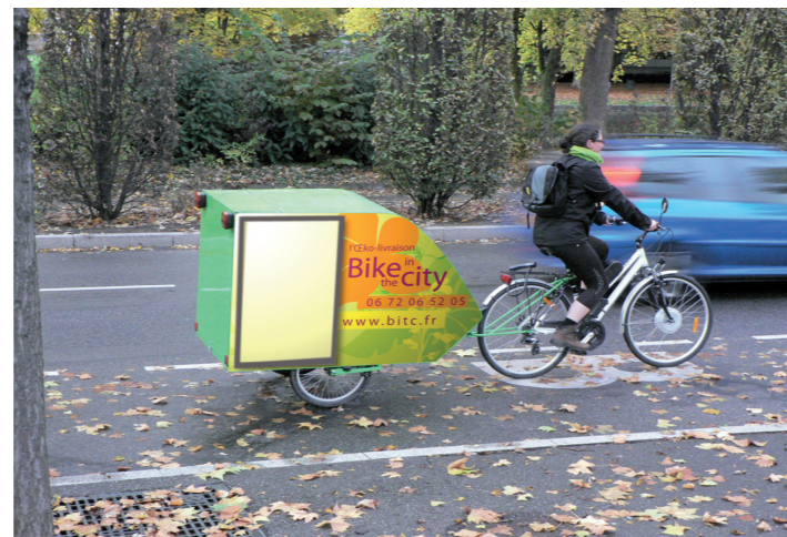
Distribution du PÉRISCOPE par la jeune société : «Bike in the city»

Le PÉRISCOPE veut se positionner comme un modèle pour le monde des entreprises à la fois par son contenu - soutenir l'activité économique - et son organisation. Il est imprimé sur papier recyclé et sa distribution se fait dans le respect du développement durable grâce son partenariat avec une petite entreprise « Bike in the City » qui réalise la distribution à vélo. Cette distribution écologique inscrit le PÉRISCOPE dans un développement durable et économique .