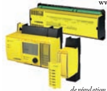
automate de régulation - SAUTER

Sauter 56 rue Jean Monnet Tél. 03 89 59 32 66 www.sauter.fr